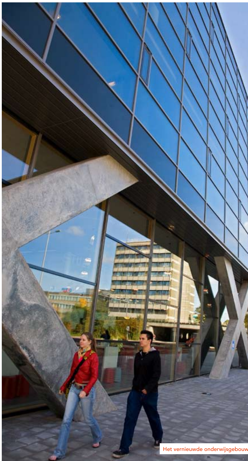
Het vernieuwde onderwijsgebouw

Vernieuwde onderwijslocatie Onderwijsweb Nieuw profiel Social Management (CMV) Hogeschool Utrecht op de NOT Op weg naar een rekenprotocol Staatssecretaris presenteert beleidsagenda